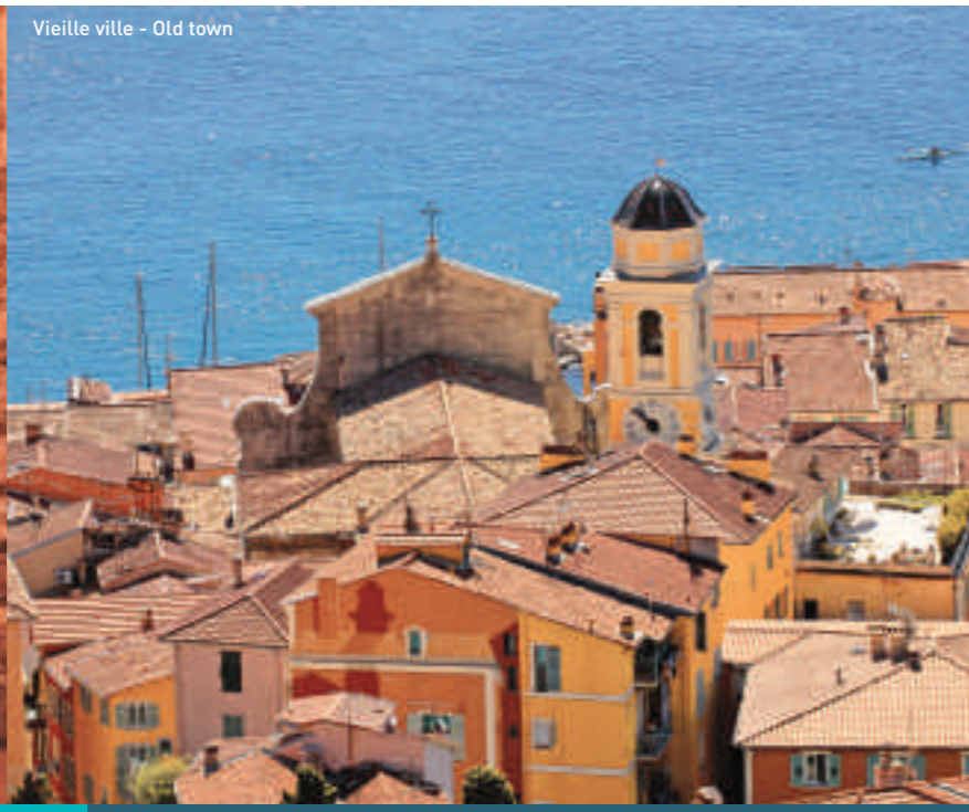
Vieille ville - Old town