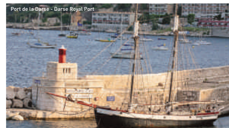
Port de la Darse - Darse Royal Port

Maritime museum : Aquarium – Models of boats – Place Wilson Open every day all year from 10.00am to 12.00am Opening on request, tel: + 33 (0) 4 93 01 11 60 Free entry