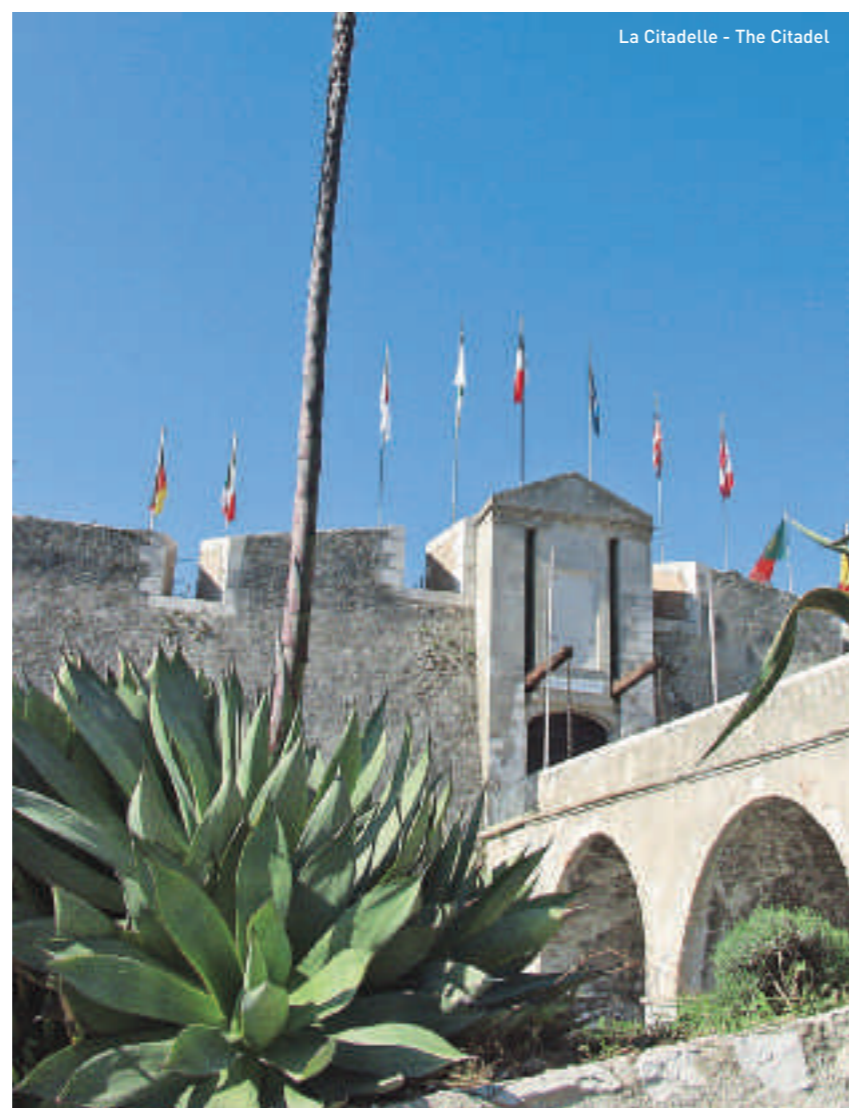
La Citadelle - The Citadel

Saint Elizabeth's Chapel (Rue de l'Église) 16 th century chapel: it is a now a venue for temporary exhibitions.